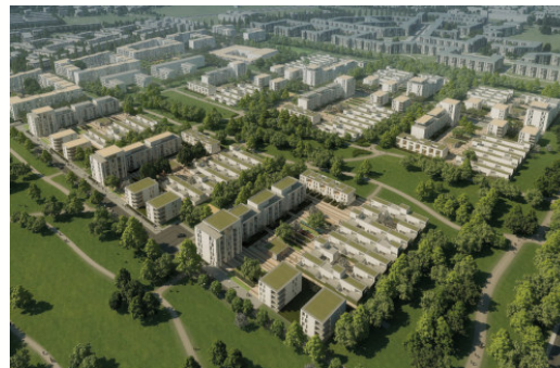
/sualisierung des Prinz-Eugen-Parks mit der ökologischen Mustersiedlung